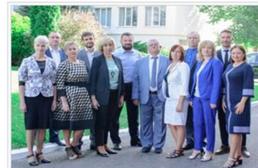
Кафедра економічної та соціальної географії